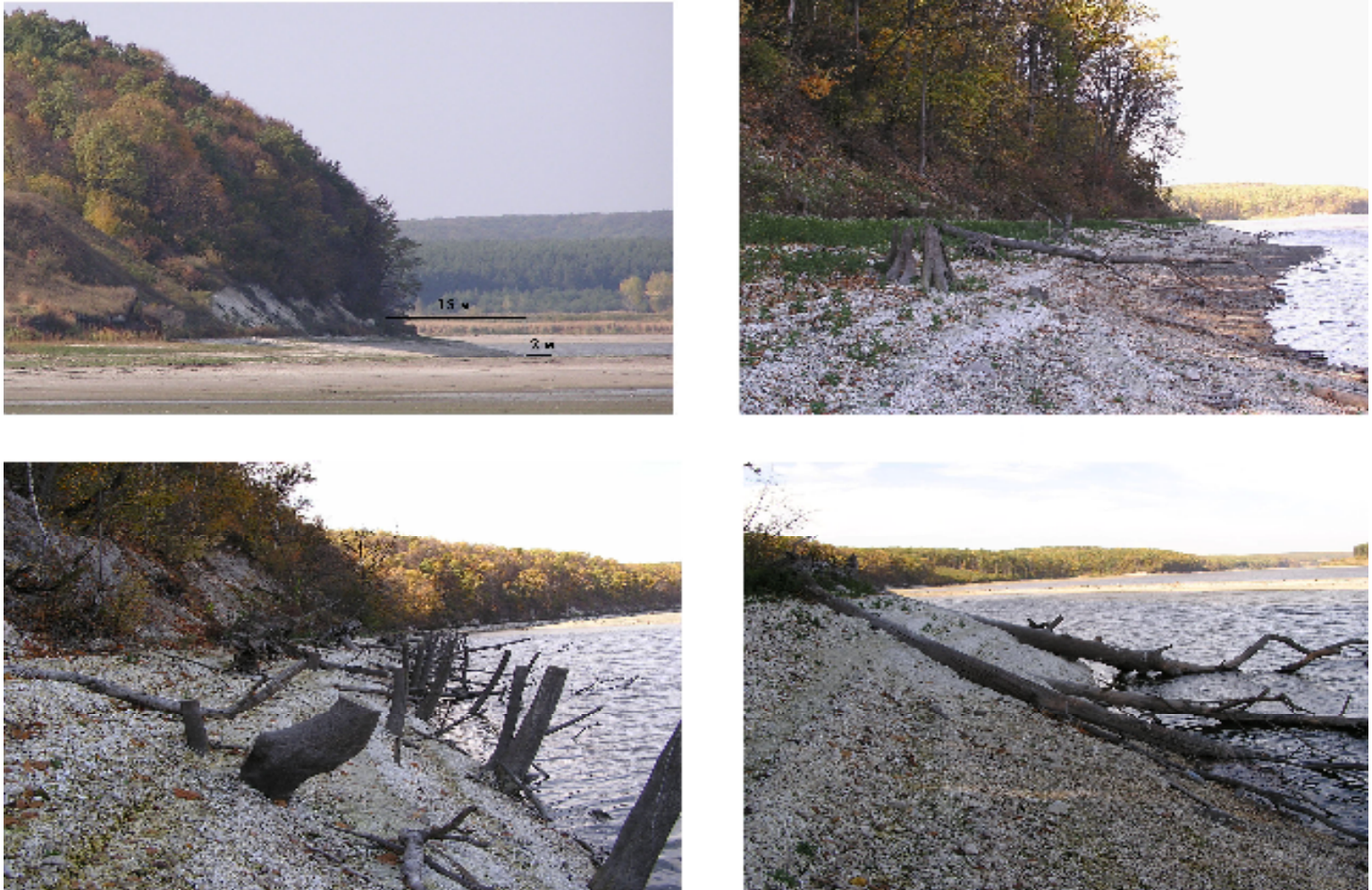
Рис. 3. Наиболее молодые геологические фации щебнисто-древяно-гравийного мело-мергельного аллювия и соответствующий им в рельефе абразионно-аккумулятивный склон береговой зоны Белгородского водохранилища