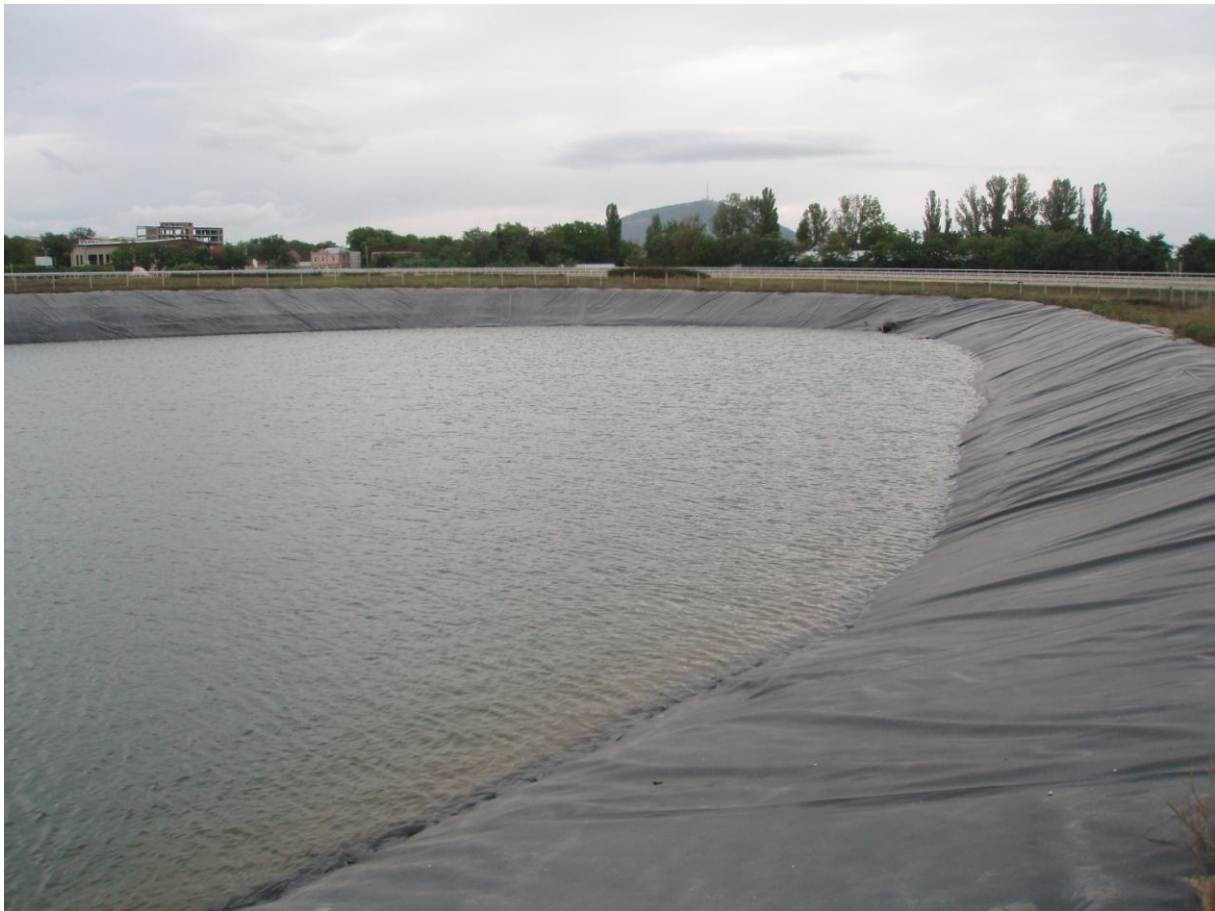
Рисунок 2 –Водоем-накопитель с поверхностным противофильтрационным экраном из геомембраны

При проведении обследования недоваров и пережегов швов и повреждения геомембраны не обнаружено, по результатам исследований водного баланса осредненный коэффициент фильтрации покрытия составил k'_{\text{обл}} = (8,83 \div 1,32) \cdot 10^{-9} см/с, что свидетельствует о высокой противофильтрационной эффективности покрытия и соответствует зарубежным данным [3].