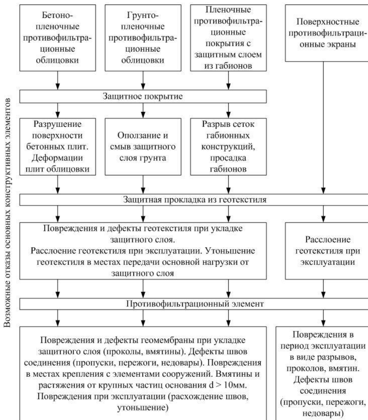
Рисунок 3 – Виды отказов конструктивных элементов противofiltrационных облицовок

Отказ защитного покрытия возможен в процессе эксплуатации объекта вследствие воздействия на покрытие негативных факторов внешней среды, пучений и осадок грунтов подстилающего основания. Защитная прокладка из геотекстиля может повреждаться как при эксплуатации канала, так и при проведении строительного-монтажных работ вследствие нарушений правил укладки защитного покрытия. Вероятность отказа противо-