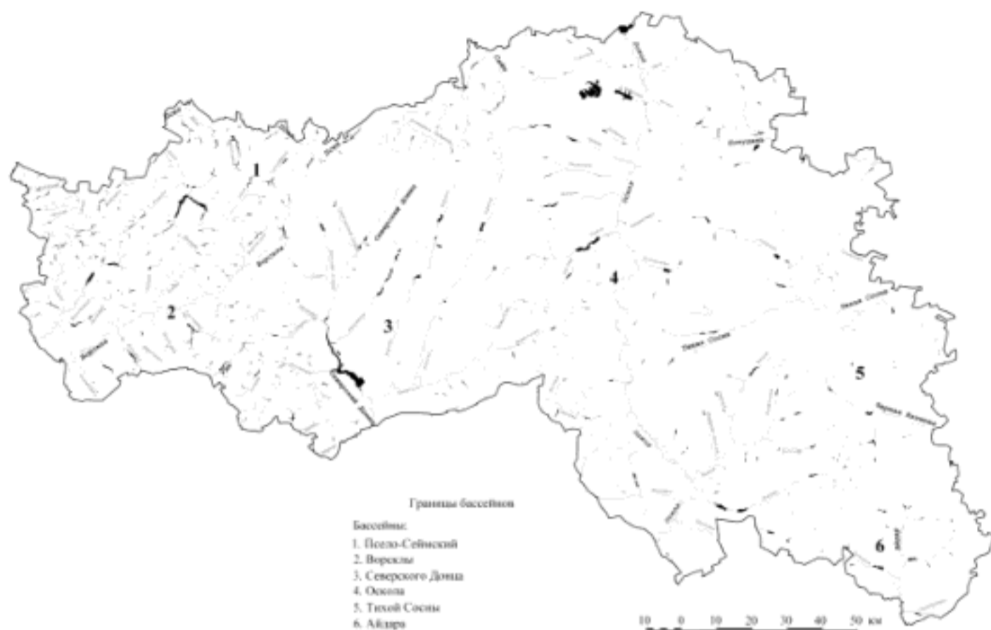
Рис. 2. Гидрографическая сеть Белгородской области 2010 г.