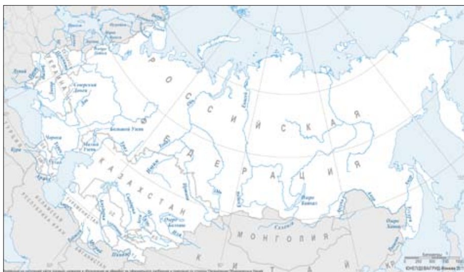
Рисунок 1.2. Обзорная карта основных трансграничных поверхностных вод СНГ

Достижение целей и задач Стратегии экономического развития СНГ во многом связано с обеспеченностью отраслей экономики водными ресурсами, улучшением доступа населения к качественной питьевой воде, решением экологических проблем в бассейнах рек. В этой связи особое значение приобретает совершенствование управления водными ресурсами, комплексного использования и охраны вод.