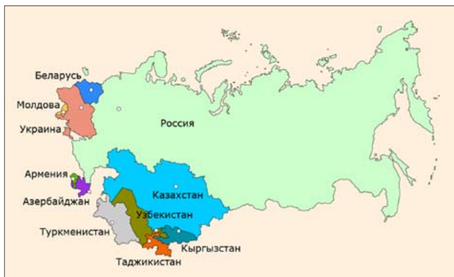
Рисунок 1.1. Карта Содружества Независимых Государств

Содружество Независимых Государств – региональная международная организация, призванная регулировать отношения сотрудничества между странами, ранее входившими в состав Союза Советских Социалистических Республик (СССР). Содружество создано в декабре 1991 года, объединяет Азербайджанскую Республику, Республику Армению, Республику Беларусь (РБ), Республику Казахстан (РК), Кыргызскую Республику, Республику Молдова, Российскую Федерацию (РФ), Республику Таджикистан, Республику Узбекистан и Украину. С августа 2005–го Туркменистан вышел из действительных членов организации и получил статус ассоциированного члена–наблюдателя, с декабря 1993 по 18 августа 2009 года в состав СНГ входила Грузия. Участники Содружества в принятой Алматинской декларации заявили о своем взаимодействии на началах суверенного равенства (СНГ, 1991).