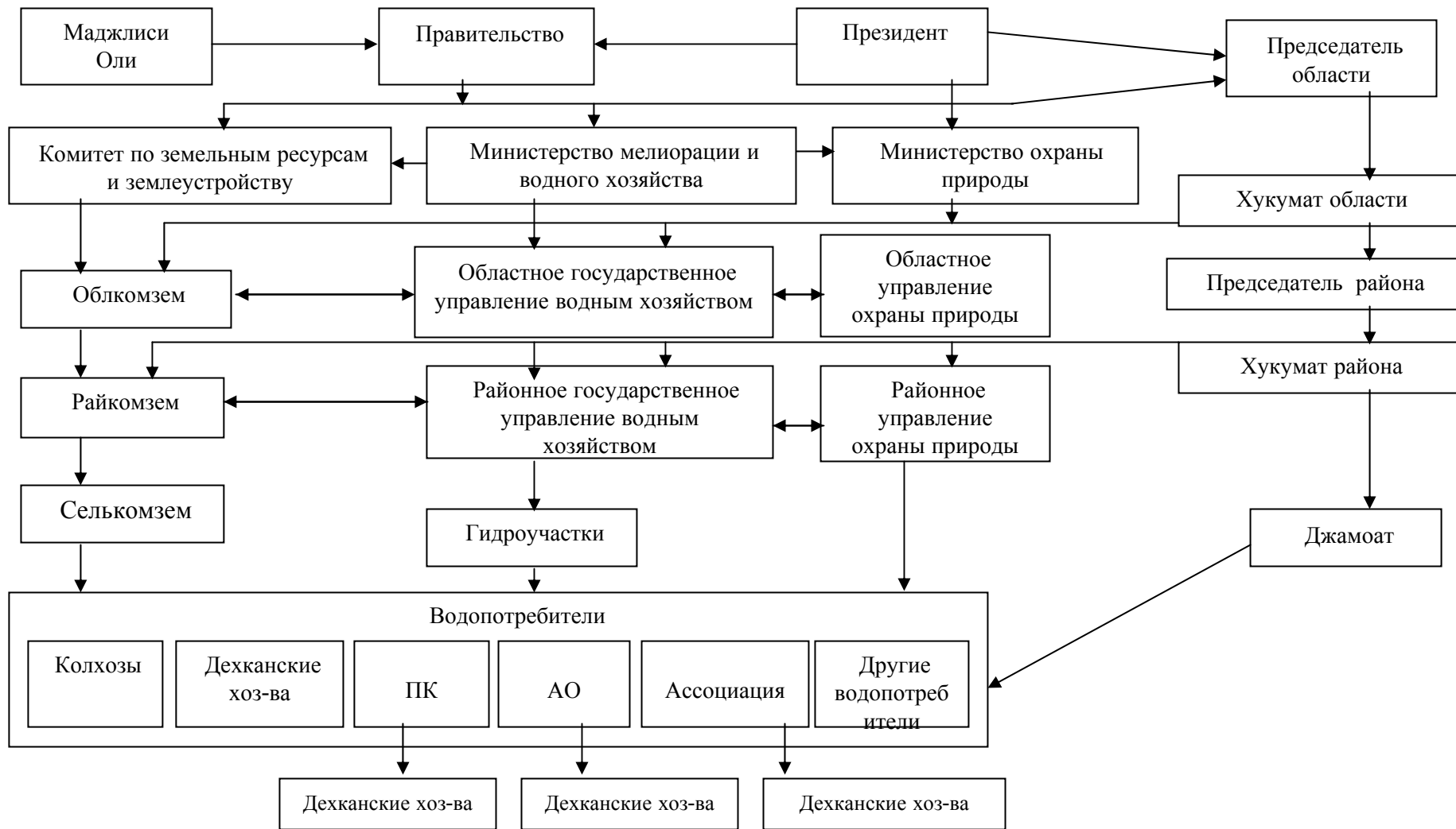
Схема управления и регулирования водных отношений в Республике Таджикистан