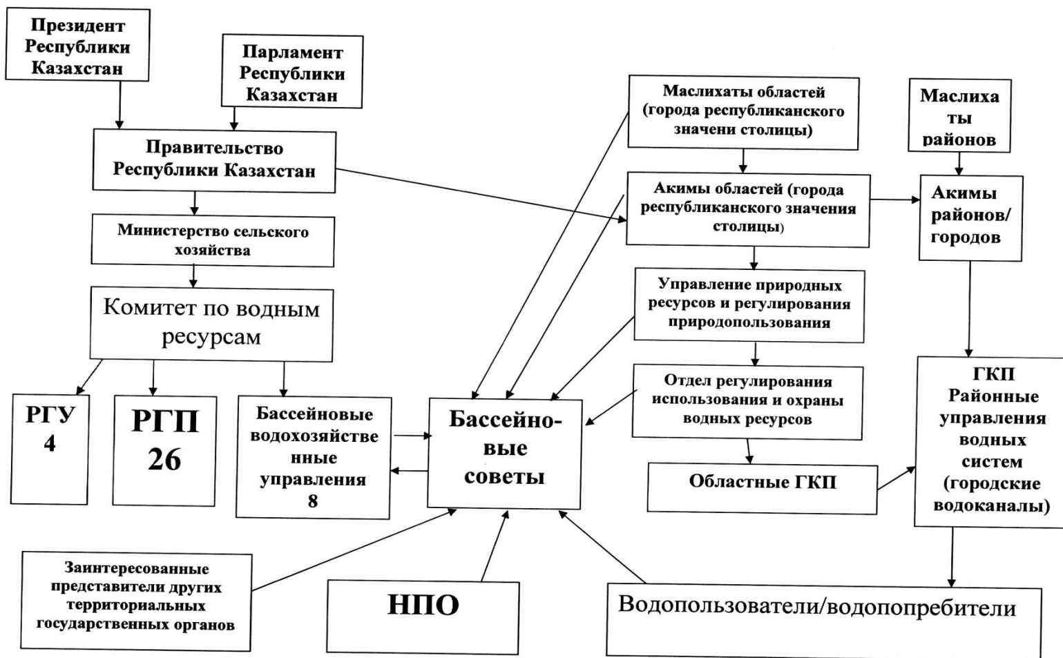
Схема управления и регулирования водных отношений в Республике Казахстан