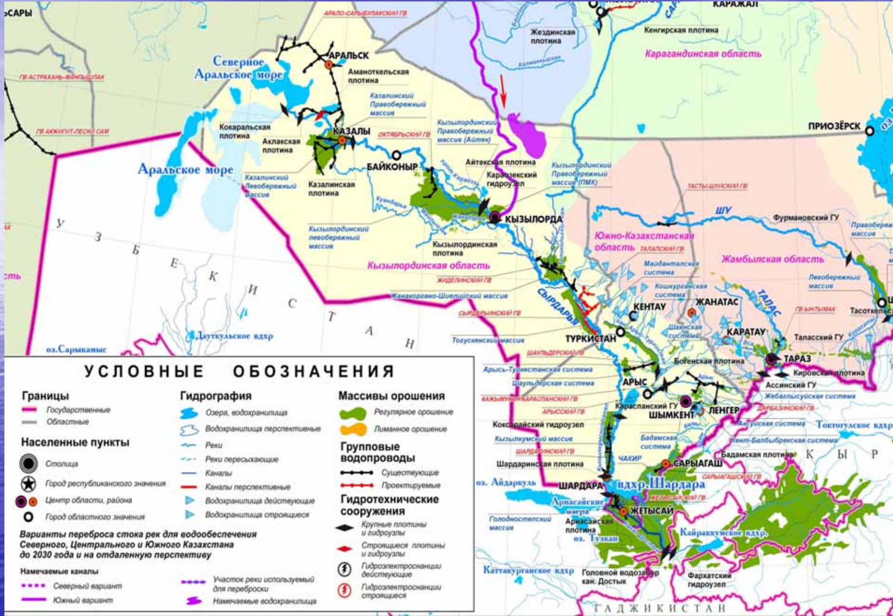
Схема бассейна реки Сырдарья